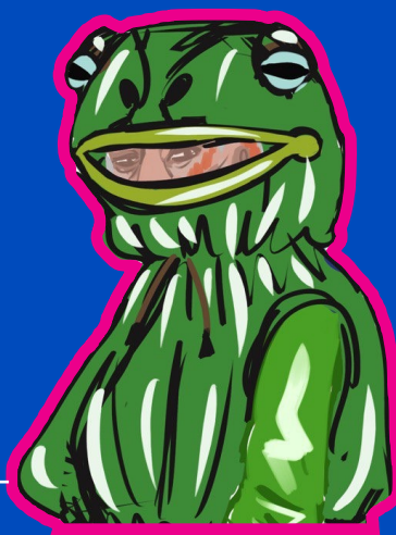
Imperméable grenouille - projet de Malou Galinou