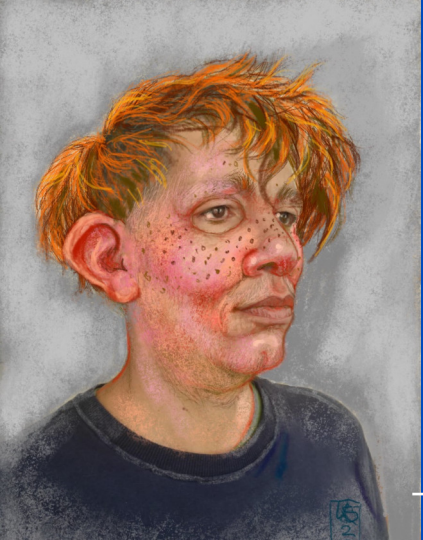
Masques - projet de Kuno Schlegelmilch